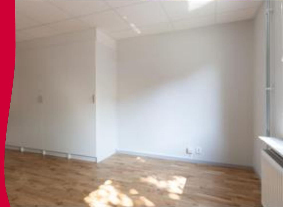
Foto med AI-genererad inredning

“Öbos hemsida var bra men jag saknade bilder på lägenheten”